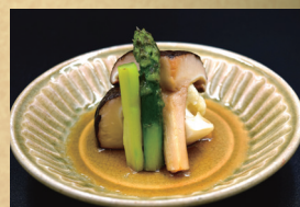
大椎茸のバターソテー