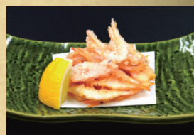
富山産白海老かき揚げ